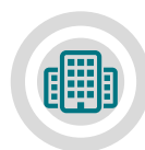
Información del Resort