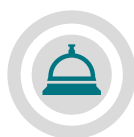
Servicio al Huésped