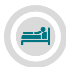
Compras desde la habitación