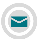
Mensajes a Clientes Específicos