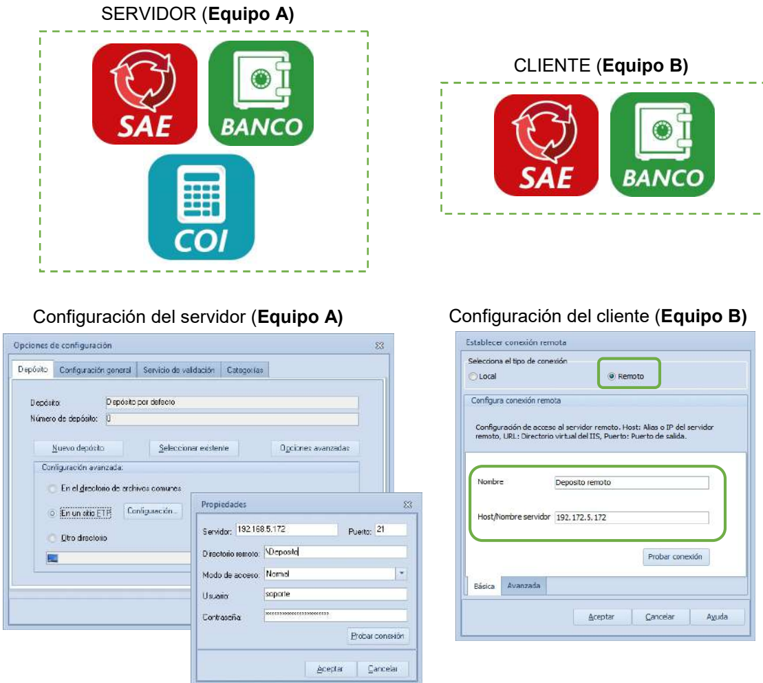
Figura 4. Uso de depósito remoto

A continuación, se muestra un ejemplo del uso recomendado de los depósitos remotos: