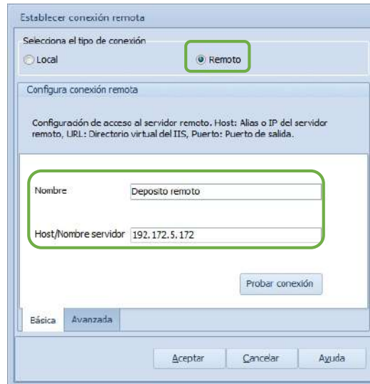
Figura 2. Establecer conexión remota