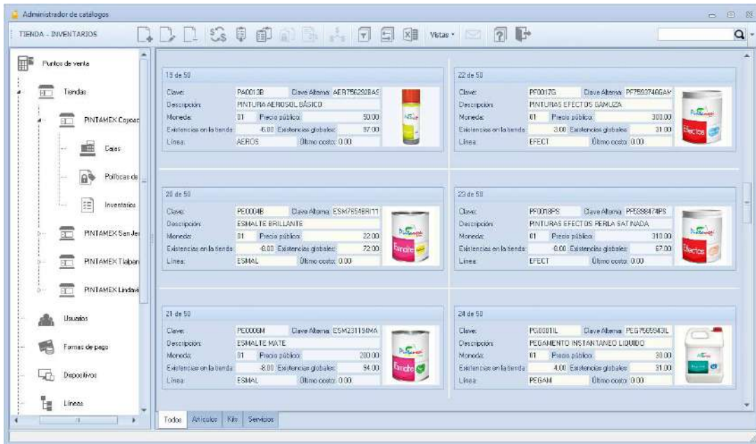
Figura 9 Inventario.

Con solo el registro del inventario ya se estará listo para realizar operaciones de venta.