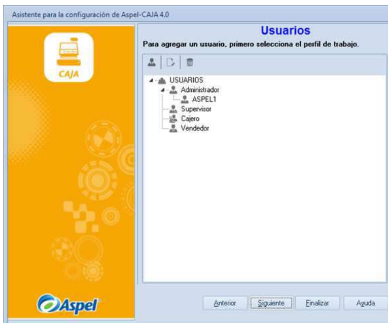
Figura 6 Alta de usuarios.

Para dar de alta los usuarios es necesario primero seleccionar el perfil de trabajo.