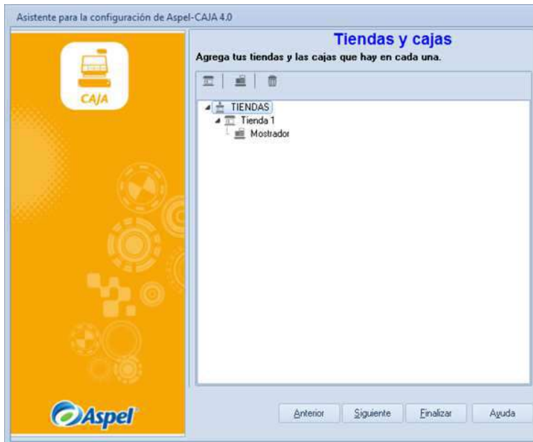
Figura 5 Alta de tiendas y cajas.

Se deben dar de alta todas las tiendas y cajas necesarias, recordando que se pueden dar de alta hasta 99 cajas.