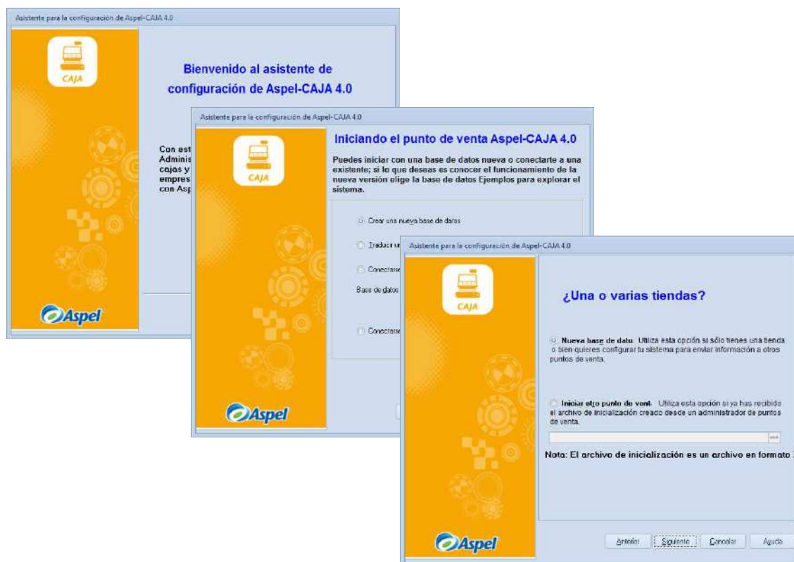
Figura 2 Configuración del sistema.

En la pantalla Iniciando el punto de venta Aspel-CAJA 4.0 , se debe seleccionar Crear una nueva base de datos , y en la pantalla ¿Una o varias tiendas? Seleccionar Nueva base de datos .