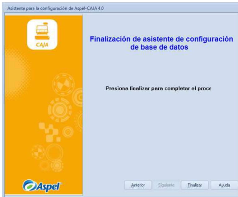
Figura 8 Finalización de configuración.

Para terminar con la configuración solo es necesario dar clic en el botón Finalizar.