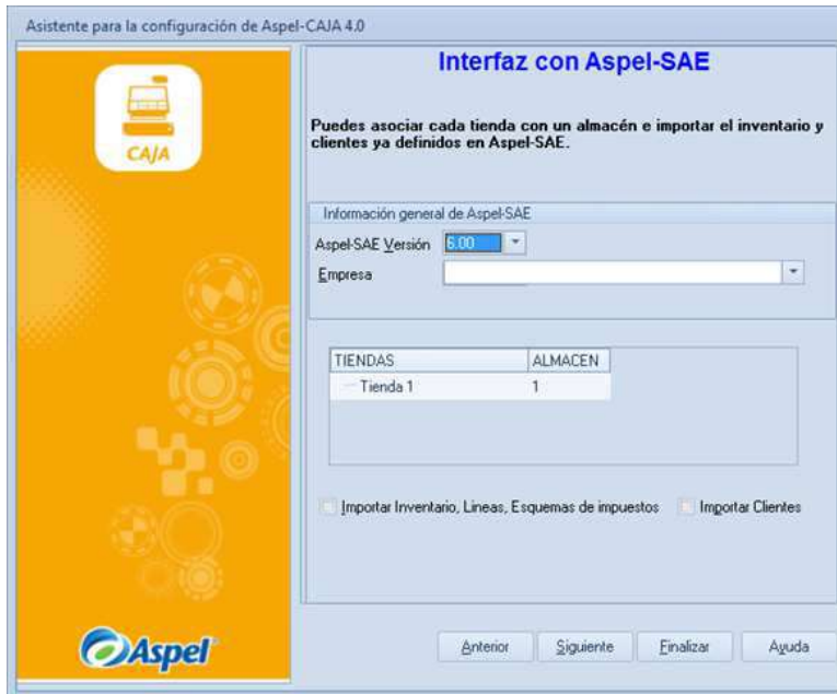
Figura 7 Interfaz con SAE.

Si se trabaja con Aspel-SAE es posible asociar cada tienda con un almacén e importar el inventario y clientes que se tengan ya definidos en Aspel-SAE. Se debe indicar la versión, la empresa de SAE y de CAJA se debe indicar la tienda.