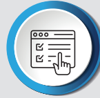
DIAGRAMA DEL ARQUITECTURA

Habilitar nuevos canales de comunicación ciudadana para reportes y consultas.