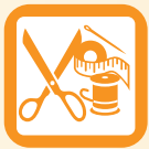
Servicios a la medida