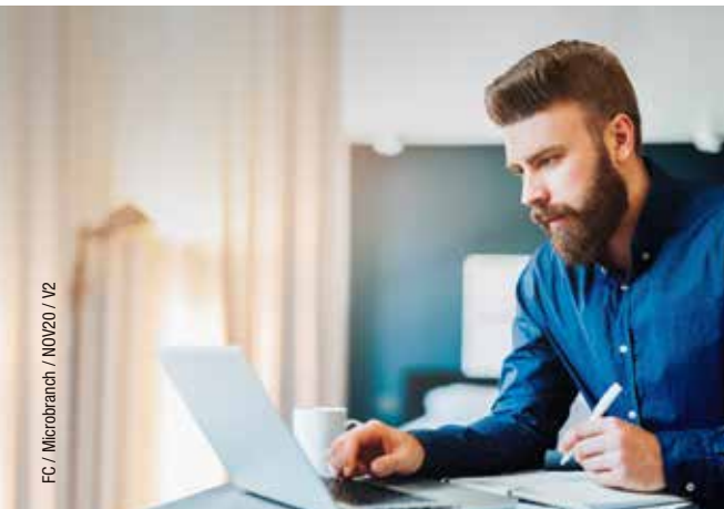
FC / Microbranch / NOV20 / V2

Brinda al colaborador herramientas para poder trabajar desde casa con una conexión a internet segura manteniendo la misma experiencia que en la oficina.