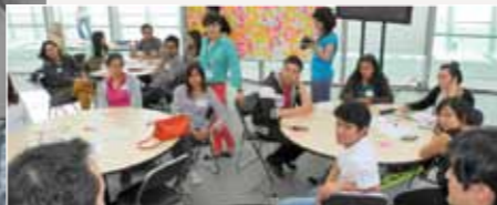
La Gira TELMEXhub visitará pronto más ciudades de nuestro país. Consulta www.telmexhub.mx/gira